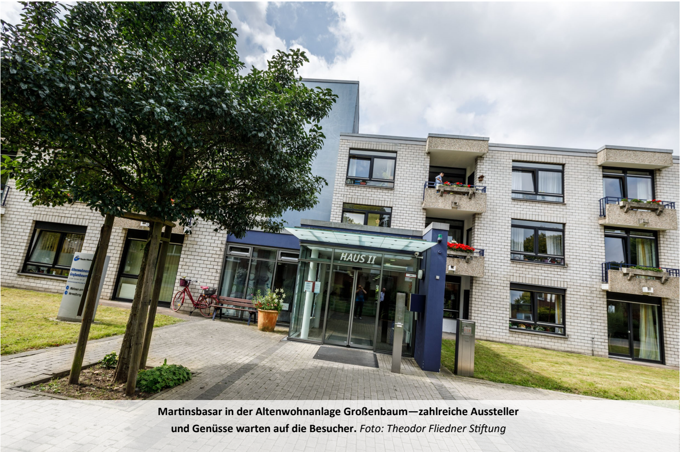
Martinsbasar in der Altenwohnanlage Großenbaum—zahlreiche Aussteller und Genüsse warten auf die Besucher.

In der Altenwohnanlage Großenbaum kommen Händler zum Martinsfest zusammen